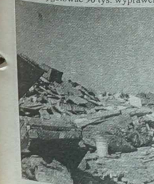
Wrocław, dzielnica Kozanów, z dnia 28 sierpnia.

Oprocentowanie pożyczki wynosi 2% w skali roku. Poza tym nadal trwają zbiórki pieniędzy i darów dla powodziann organizowane przez rozmaite organizacje, stowarzyszenia i fundacje. I tak: Caritas Polska na pomoc ofiarom żywiołu przekazał 31 mln zł, PCK 23 mln zł, rezultatem akcji „Byłaś wzywaniem Powodziannom” była suma 22,5 mln zł. Specjalnie dla powodziann zagrała Wielka Orkiestra Symfoniczna Pomocy, która przekazała społeczeństwu kwotę 950 tys. zł. Do końca sierpnia trwała akcja „Zeszyty” zorganizowana przez Związek Harcerstwa Polskiego. Zebrane pieniądze i akcesoria szkolne pozwoliły harcerzom przygotować 90 tys. wyprawek