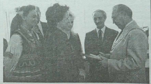
U prezydenta miasta Koszalin.