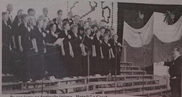
Po raz ósmy na festiwalu śpiewa „Hutnik” z Czech.