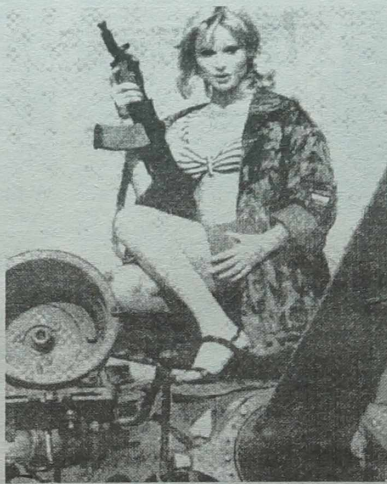
Mimo kłopotów armia nie żałuje pieniędzy na promocję. Także z modelkami na czołgach.

Zdaniem ekspertów Paktu Atlantyckiego, poprzez roz-