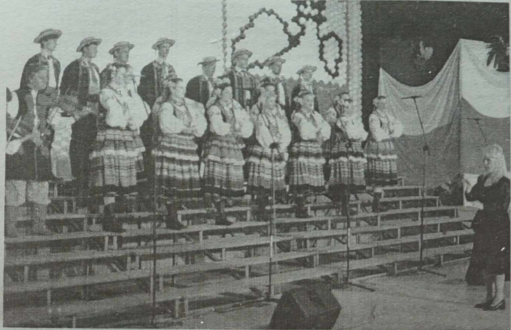
Śpiewa ludowy zespół pieśni i tańca „Wilia”.