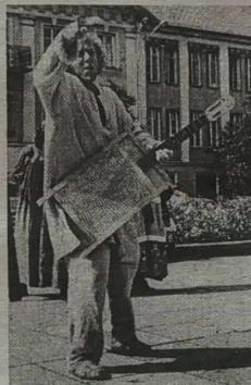
Fragment święta.