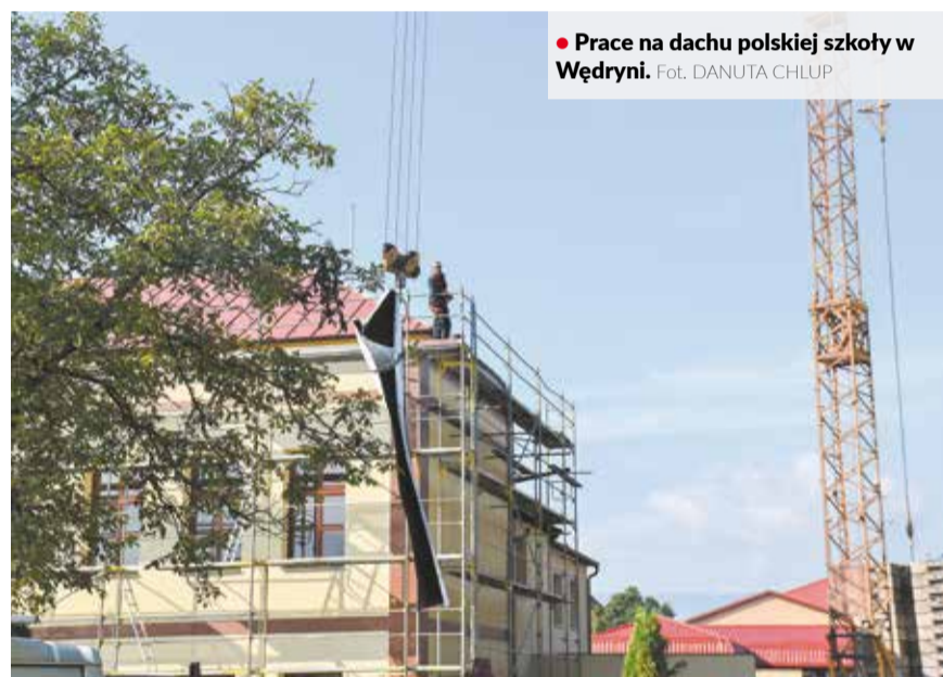
• Prace na dachu polskiej szkoły w Wędryni.