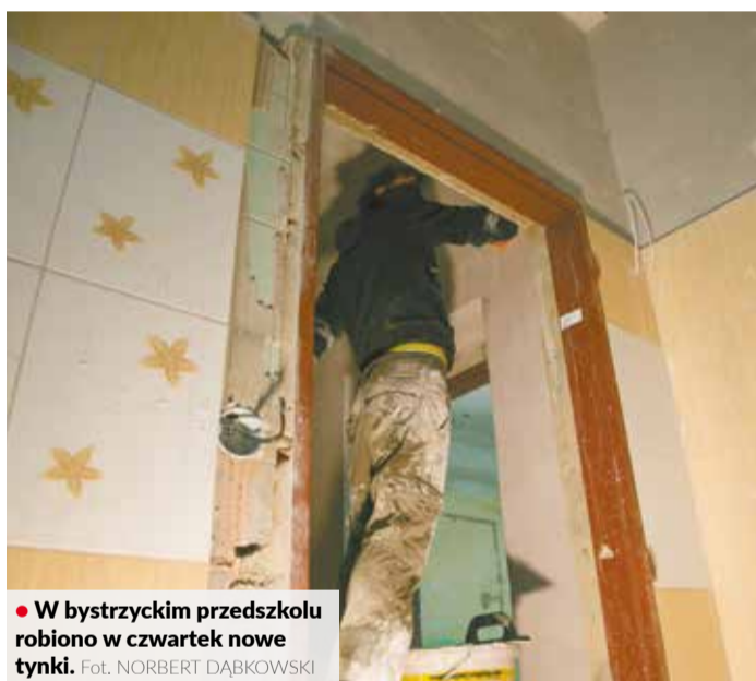
• W bystrzyckim przedszkolu robiono w czwartek nowe tynki.