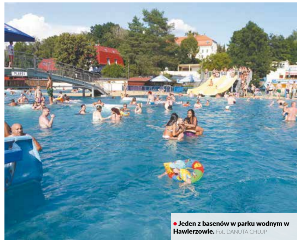
• Jeden z basenów w parku wodnym w Hawierzowie.

Upały panujące w tym tygodniu zachęcają do korzystania z basenów letnich. Liczba odwiedzających została w związku z koronawirusem ograniczona, lecz – jak się przekonał – raczej nie stwarza to problemów.