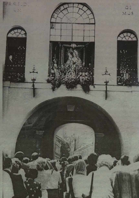
Ostra Brama - słowo do wiernych.