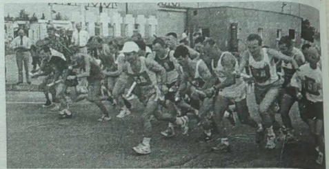
W niedzielę odbył się tradycyjny bieg sztafetowy Miedniki - Cmentarz Antokolski w Wilnie dla uczczenia rocznicy tragicznej śmierci pracowników ochrony granicznej. W biegu wzięło udział 45 drużyn, składających się z siedmiu biegaczy. Każdy z nich przebiegł po 5 km. Najlepszy czas uzyskał zespół z Malych Świąć. Drugi czas u biegaczy z Poniewieża, a trzeci z rejonu Janowskiego.