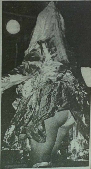
KĄCIK HUMORU Artystka od kulis. Zgadnij, kto to taki?