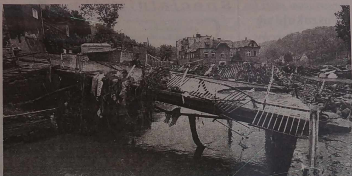
NA ZDJĘCIU: jeden z mostów przez Nysę w Kłodzku w południowo-zachodniej Polsce. Stan po powodzi.