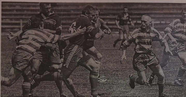
Graj rugbyści Litwy i Rosji.