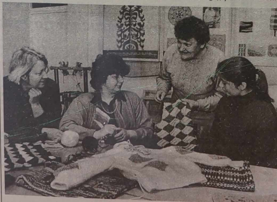
Praktyczne zajęcia na kursie „Rzemieślnik artystyczny i organizator handlowy”