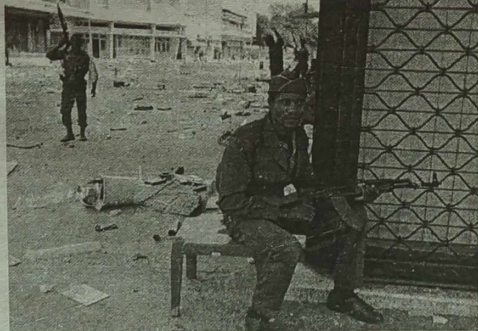
Strzelanina mimo rozejmu

krzyżem, zapraszając do siebie przymocników stron konfliktu, by wspólnie „znaleźć środki sprawiedliwego i trwałego pokoju”. Do udziału w rozmowach zaprosił też przedstawicieli ONZ, Organizacji Jedności Afrykańskiej, Francji i Unii Europejskiej.