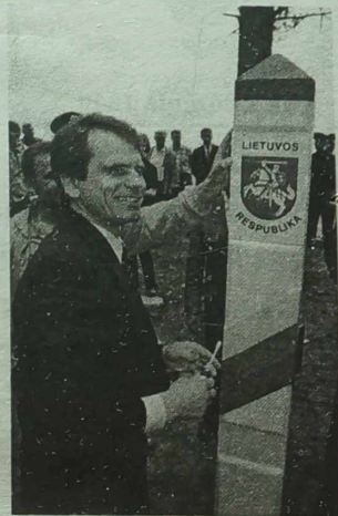
Autentyczną granicę państwową długości 650 km zaznacza 1642 słupy żelbetowe.

Wszystkie prace w zakresie demarkacji granicy, jak twierdzi minister spraw wewnętrznych Litwy V. Ziemelis, mają być wykonane nie później niż do końca roku 1998, a „może i wcześniej”. Ta praca uwieńczyłby jeden z głównych etapów w drodze do Unii Europejskiej, powiedział minister.