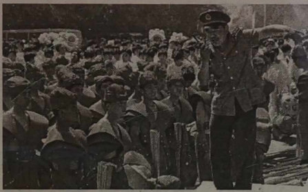
Przygotowania idą pełną parą

ny polityk brytyjski Chris Patten, rzecznik demokratyzacji kolonialnego systemu. 26 września 1985 r. odbyły się w kolonii pierwsze w historii Hongkongu posiedzenie, częściowo wybory do Rady Ustawodawczej - wybory bezpośrednie miały miejsce dopiero w 1995 r. Wywołało to irytację postawionego przed faktem dokonanym Pekinu, który oskarżył