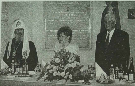
Prezydent Rosji z okazji święta wydał na Kremlu uroczyste przyjęcie

Dzień wolny od pracy po swojemu wykorzystają partie polityczne, zapraszając Moskwan na polityczne demonstracje. Liberalno-Demokra-