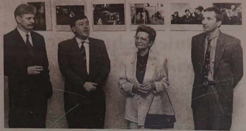
W Instytucie Polskim w Wilnie