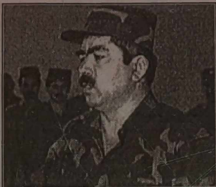
Na ZDĘCIAE: Raszid Dostum

Wydarzenia na północy Afganistanu poważnie zaniepokoiły Rosję, która obawia się wzrostu wpływów fundamentalistów islamskich w środkowoazjatyckich krajach byłego ZSRR. Moskwa ostrzegła w sobotę,