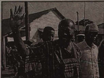
Ahmad Tejan Kabbah

go Frontu Rewolucyjnego oraz ataków armii padło ponad 10 tys. ludzi. Prawie połowa spośród 4 mln mieszkańców Sierra Leone uciekła albo do sąsiednich krajów, albo schroniła się w większych miastach.