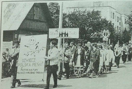
VII Festyn Kultury Polskiej