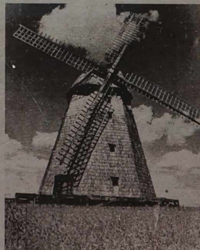
NA ZDJĘCIACH: stary XVIII-wieczny wiatrak w rejonie poniewieskim; nowy młyn SA „Malsena”.

Prócz pszennej mąki najwyższej jakości we młynie wytwarza się otręby, kaszę mąną, kiełki pszenicy. Nim ziarno pszenicy przekształci się w te produkty, przechodzi ono przez dzie-