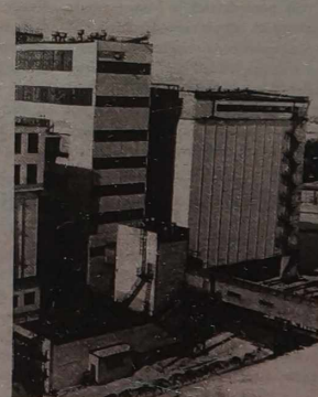
NA ZDJĘCIACH: stary XVIII-wieczny wiatrak w rejonie poniewieskim; nowy młyn SA „Malsena”.

Nadzwyczajnym cennym produktem są kiełki pszenicy, zawierające mnóstwo substancji organicznych, białka, witamin, tłuszczów, węglowodanów. Skład chemiczny kiełków badano w Szwajcarii, Włoszech, USA, Niemczech, W. Brytanii, Polsce, Japonii, Rosji. Młyn poniewieski zaczął dostarczać je konsumentom w lutym 1996 roku.