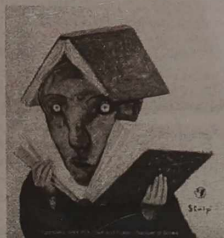
Tradycyjny emblemat Targów Warszawskich, autorstwa Stasysa Eidrigevicziusa.

scę, chcę podkreślić, że ci, co nas lubią, co interesują się literaturą naszego kraju – zawsze nas odnajdują w tym ogromnym i tak w majowych dniach ożywionym i przepelnionym Pałacu Nauki i Kultury. (Dokończenie na str.3)