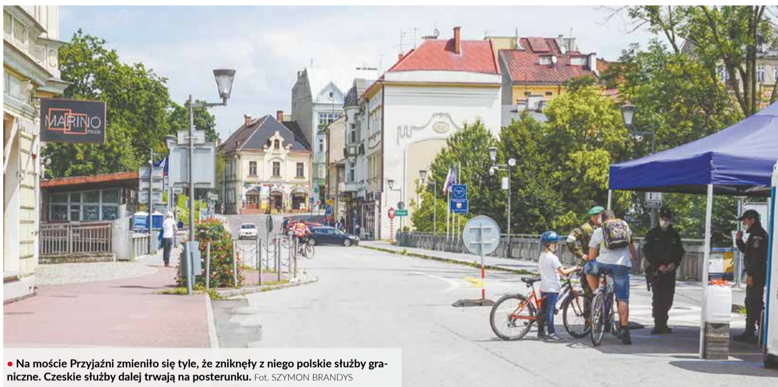
• Na moście Przyjaźni zmieniło się tyle, że zniknęły z niego polskie służby graniczne. Czeskie służby dalej trwają na posterunku.

Co oznacza piątkowa decyzja o czerwonym świetle dla województwa śląskiego? Przede wszystkim wprowadziła ogromny chaos. Wielu internautów pytało pod postami na naszym fanpage’u na Facebooku o szczegóły. Niektórzy wysyłali do nas wiadomości typu: „Bardzo proszę o radę. Mamy jechać autem z Brna do Tarnowa... (woj. małopolskie). Nie wiemy przez jaką granicę pojechać bez testu na COVID-19. Jadę do rodziny”, „Co, jeśli mieszkam w Czechach z rodziną, tutaj pracuję, tutaj urodziły mi się dzieci. Nie