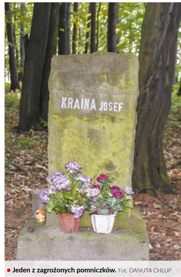
• Jeden z zagrożonych pomniczków.