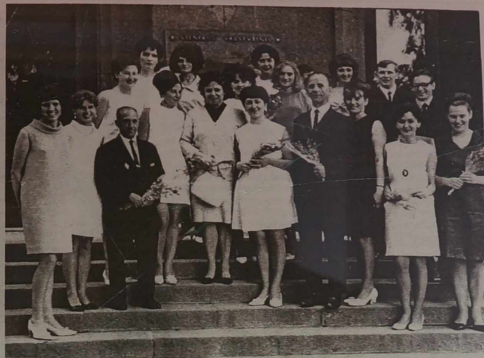
Na zdjęciu: tuż po wręczeniu dyplomów.

Nie ma w Polsce niekt wątpliwości-ani ambasada, ani inne instytucje rządowe - co do tego, że absolutnie szkoły polskiej musi znać język litewski i to na poziomie dobrej szkoły litewskiej. Bo brak znajomości tego języka, ogranicza możliwości dalszego kształcenia się i pracy. Pani Ambasador uważa, że rząd powinien stworzyć przedstawicielom miniejszo-