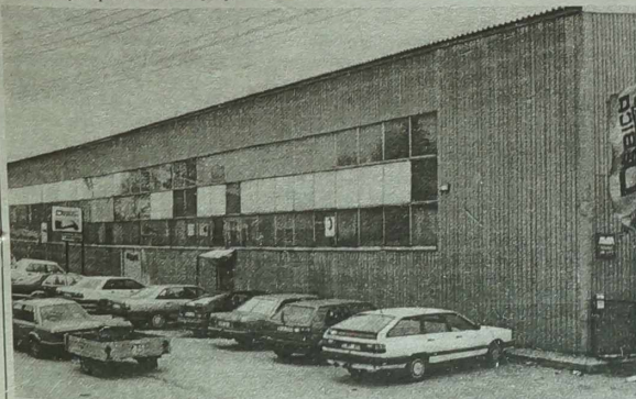
Główny hangar przedsiębiorstwa.

Barbara ZNAJDZIŁOWSKA