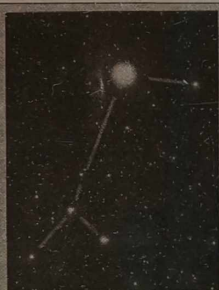
Syriusz - najjaśniejszy obiekt w gwiazdozbiornie Wielkiego Psa - jest gwiazdą podwójną.