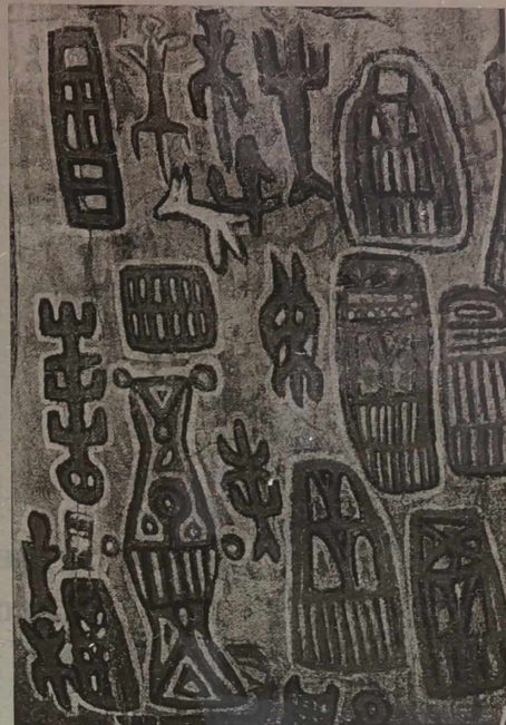
Rysunki naskalne namalowali przed kilkuset laty przodkowie dzisiejszych Dogonów. Być może są one przekładem ich rzeczywistości na język symboli przypadkowo przypominających realia naszego współczesnego życia, a może obrazem sprzętów i zdarzeń widzianych w zamierzłej przeszłości.

czekaniu mit kosmogoniczny zbudowany z informacji zaczerpniętych z dorobku nowoczesnej astronomii? Nie można tego wykluczyć. Wiadomości astronomiczne mogli dostarczyć im chrześcijańscy misjona-