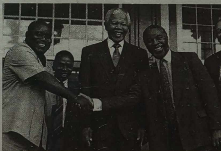
Organizatorzy spotkania twierdzą, że Mandela doradzał Kabilę, by spotkał się z Mobutu.

Laburzyści usiłują zbić polityczny kapitał na podziałach w Partii Konserwatywnej w kwestii stosunku do Europy. Konserwatyści zwracają uwagę, że podziałcy występują także wśród laburzystów, a powodem, dla którego nie uszczętniętą, jest to, że opozycja postawiła wszystko na jedną kartę - wyborczej zwycięstwa, a lider Partii Pracy skłębnie (tłumi wewnętrzpartijną debatę) na bardziej kontrowersyjne tematy.