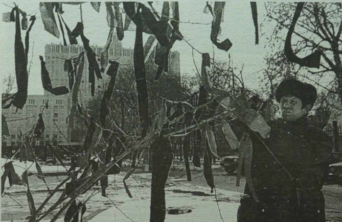
Radykalnie komunistyczna „Trudowa Roszija” zorganizowała wiec przed siedzibą rządu w rocznicę tragicznych wydarzeń pod rosyjskim „Białym Domem” w październiku 1993 r. Czerwonymi i czarnymi wstążkami ozdobiłono drzewka ku pamięci ofiar ataku na rosyjski parlament.

Radykalnie komunistyczna „Trudowa Roszija” zorganizowała przed siedzibą rządu na Bulwarze Krasnej Presni wiec, poświęcony pamięci ofiar tragicznych wydarzeń moskiewskich w październiku 1993 roku.