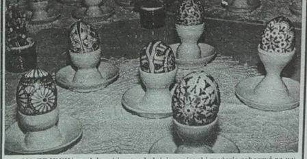
NA ZDJĘCIU: podobne i jeszcze ładniejsze pisaniki możecie zobaczyć na wystawie w „Kuparasi”. Przy dobrej chęci możecie je też wyzwarować sami.

x Centrum Sztuki Współczesnej (Vokieciu 2) Korzystamy z okazji zapoznania się z polską sztuką lat 1945-1996. Ekspozycja czynna do 10 kwietnia.