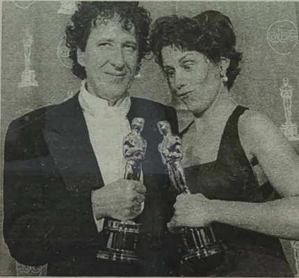
Geoffrey Rush wraz z Frances McDormand.