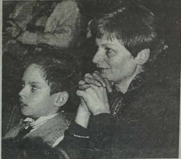
Widownia zachwycona śpiewem chórzystów.

cy - dzieciom”, który odbywał się w sobotę, 22 marca, wzięło udział ogółem 15 zespołów z Litwy, Polski i Ukrainy. Dobrym duchem, czyli reżyserem całości była kierowniczka jednego z chórów Szkoły Muzycz-