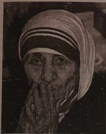
86-letnia zakonnica poprosiła w ub. r. o zwolnienie jej z funkcji ze względu na zły stan zdrowia.

Jak podały koła kościelne w Kalkucie, kandydatka siostry Nirmali została przyjęta „niemal jednogłośnie”. Matka Teresa była obecna w czasie głosowania i pobłogosławiła swą następczynię.