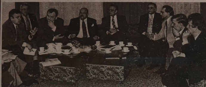
Delegacja Sejmu polskiego na spotkaniu w Polskiej Macierzy Szkolnej.