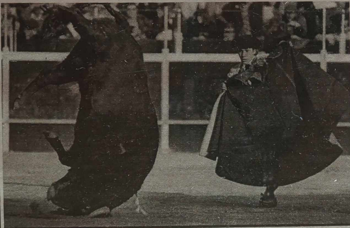
Jak widać i byki umieją fikać koziołki. Czy aby tylko z radości? Można mieć wątpliwości.

Według ITAR-TASS, urządzenie wybuchowe w rękach ochroniarza z firmy „Szerif-ER” i oberwało mu prawą dłoń. 34-letni ochroniarz z licznymi obrażeniami znajduje się w szpitalu.