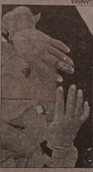
Odmrożenia, nawet wylezione, przynajmniej w początkowej fazie nie powodują trwałej uszkodzenia skóry. Palce robią się sine i czwierkniętą.

Najbardziej narażone na zbranie mrozu są dłonie, szczególnie części zewnętrzne. Dlatego ważne jest, aby nosić ciepłe rękawiczki, które chronią przed utratą ciepła. Wskazane jest również, aby nosić ciepłe skarpetki i buty, które chronią przed utratą ciepła.