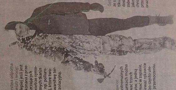
Warstwa odporna na wiatr i wodę: najlepiej jest je wykonywać z przesyłających powłok syntetycznych tkanin, jak np. poliluretan, które tworzą warstwę termozuszczalną.