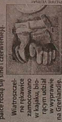
Wiatroszczelne rękawice zamocowane w kałaku, biogumy, w wyprawie na Grenlandię.