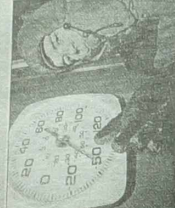
W PRZEBIEG WYPAWY