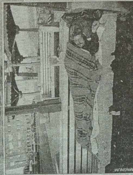
Większe ciepło ciała tracą przez głowę, dlatego bardzo istotne jest odizolowanie głowy od mrozu. Wiedzie się naskrycie.