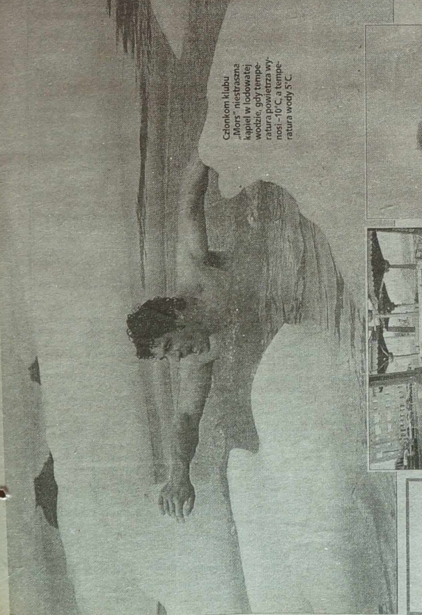
Ciepłemu kłobu „Mor” niestraszna łapki w lodowatej wodzie, gdy temperatura powietrza wynosi -10°C, a temperatura wody 5°C.