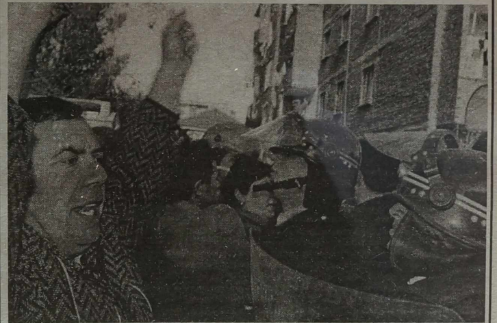
Starcia z policją w Tiranie.

szefowej banku, wśród nich jej bracia i siostry. Z powodu plaży banku doszło go starć między zdesperowanymi klientami i policją. Zatrzymano 29 osób.