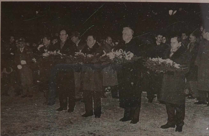
Władze Litwy składają hołd poległym 13 Stycznia 1991 roku

Dzieci poległych, wszyscy uczestnicy uroczystości z pochodniami zapalonymi przy pomniku, skierowali się na Plac Niepodległości, gdzie w pamiętne dni stycznia w dzień i w noc dyżurowali ludzie. Ogni-