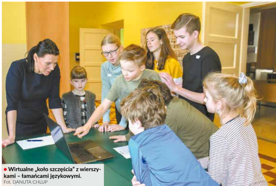
• Wirtualne „koło szczęścia” z wierszami – łamańcami językowymi.

Pierwszy dzień nauki po feriach upłynął w polskiej podstawówce w Suchej Górnej na zajęciach projektowych z okazji obchodzonego w ub. piątek Międzynarodowego Dnia Języka Ojczystego. Uczniowie sprawdzali w formie zabawy swoje umiejętności językowe.