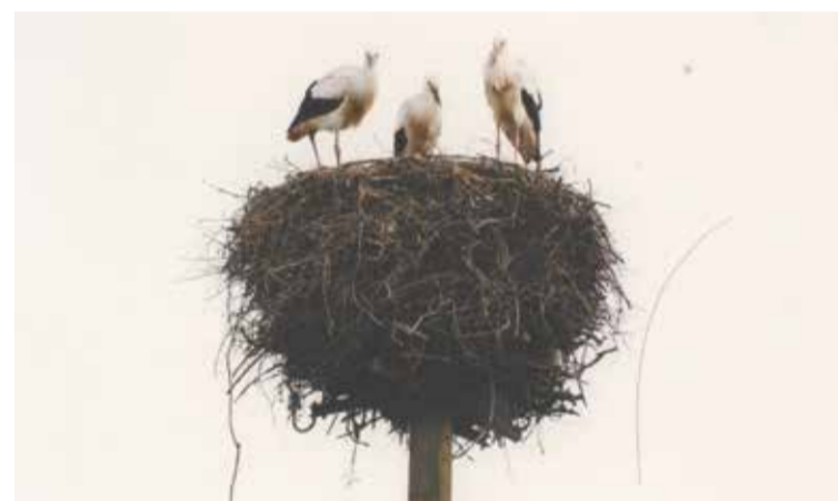
• W oczekiwaniu na przylot bocianów. Wiosna za oknem? Żeby się przekonać, trzeba rzucić okiem...