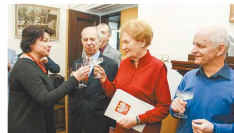
• Podczas piątkowej uroczystości nie zabrakło symbolicznego toastu szampanem.