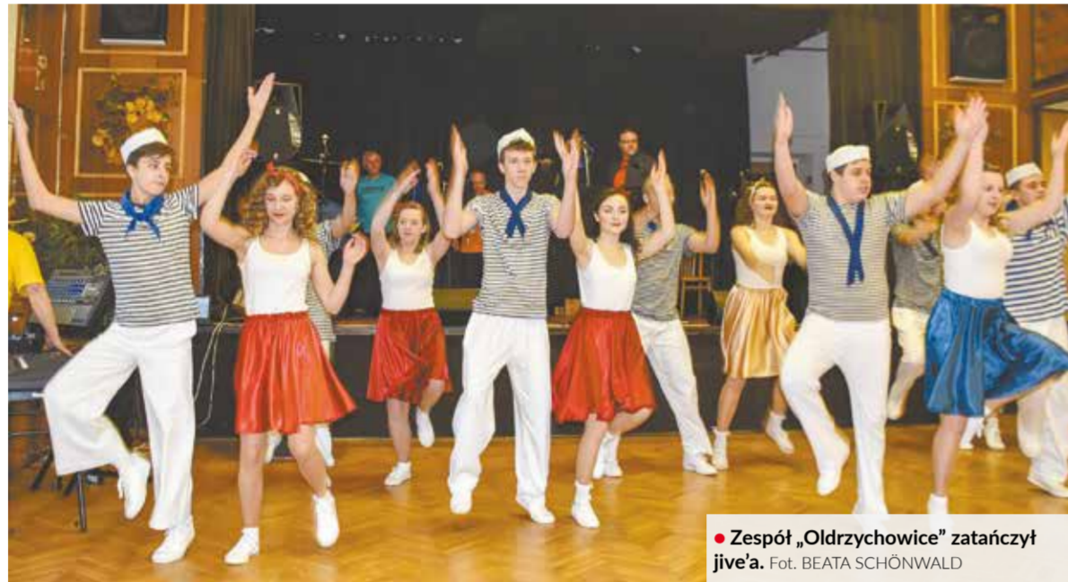
• Zespół „Oldrzychowice” zatańczył jive’a.