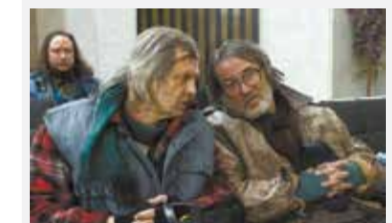
• Ach, że morderstwa Wtorek 25 lutego, godz. 21.00, TVC 1