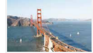
• Cudowne amerykańskie miasta Czwartek 27 lutego, godz. 20.00, TVC 2

„Głos” jest finansowany ze środków Ministerstwa Kultury RC, Ministerstwa Spraw Zagranicznych RP, Konsulatu Generalnego RP w Ostrawie, Fundacji Pomoc Polakom na Wschodzie, i Stowarzyszenia „Wspólnota Polska”