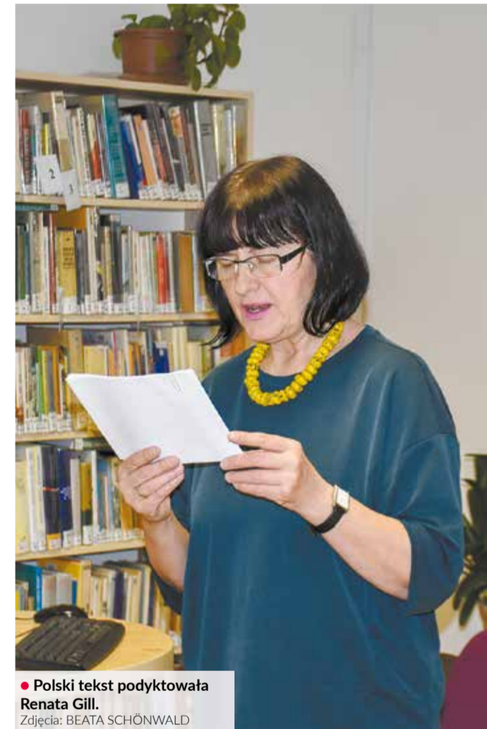
• Polski tekst podyktowała Renata Gill.