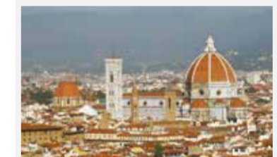
• Florencja Środa 26 lutego, godz. 9.00, TVC 2