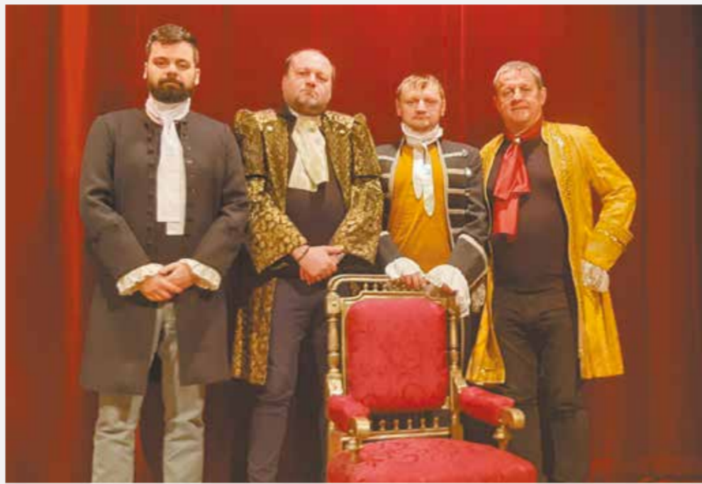
• Wędrzyńscy aktorzy mają już z sobą jedną próbę w kostiumach.

Wędrzyńska premiera „No comment” odbędzie się tydzień po Wielkanocy, 17 kwietnia o godz. 18.00 w „Czytelniku”. – Obecny ma być sam autor sztuki, co w dziełach naszego teatru chyba jeszcze nie miało miejsca – dodał Ondraszek