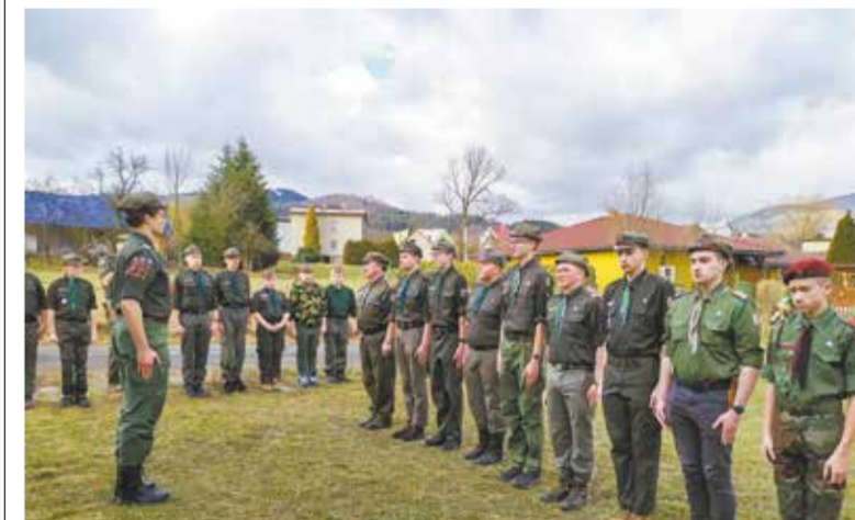
• Apel w harcerskiej bazie w Milikowie.