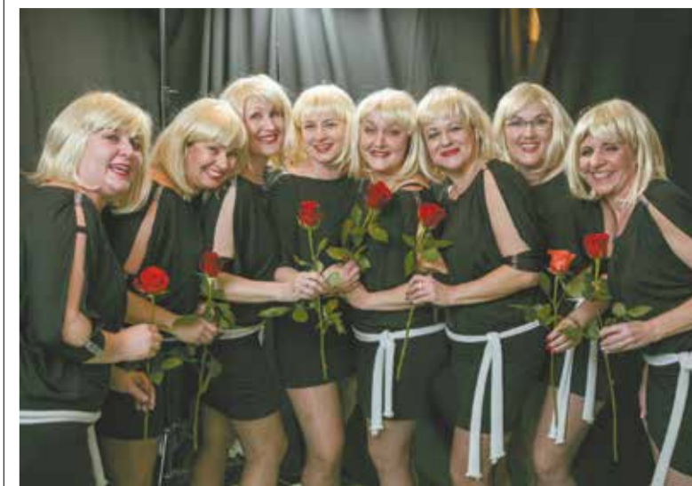
• Pamiątkowe zdjęcie po brawurowym występie to tradycyjny element Balu Ostatkowego w Wędryni.

Bal Ostatkowy w Wędryni należy do tych imprez, które ciężko pominąć w sezonie balowym. Nie dość, że program kulturalny jest zawsze widowiskowy, towarzyszy nam tańcem do piosenki „Sex Bomb” Toma Jones’a. W dodatku miejscowe kucharki także odzwierciedlały. Gwiazdami, jakie usławiły bal, byli m.in. „Gimnastki”. Przygotowali oni pokaz czarno-biały przy ultrafioletowym świetle. Z kolei część pokazu tańca brzucha w wykonaniu tancerek z Bystrzycy również odbył się w przyziemnej atmosferze.