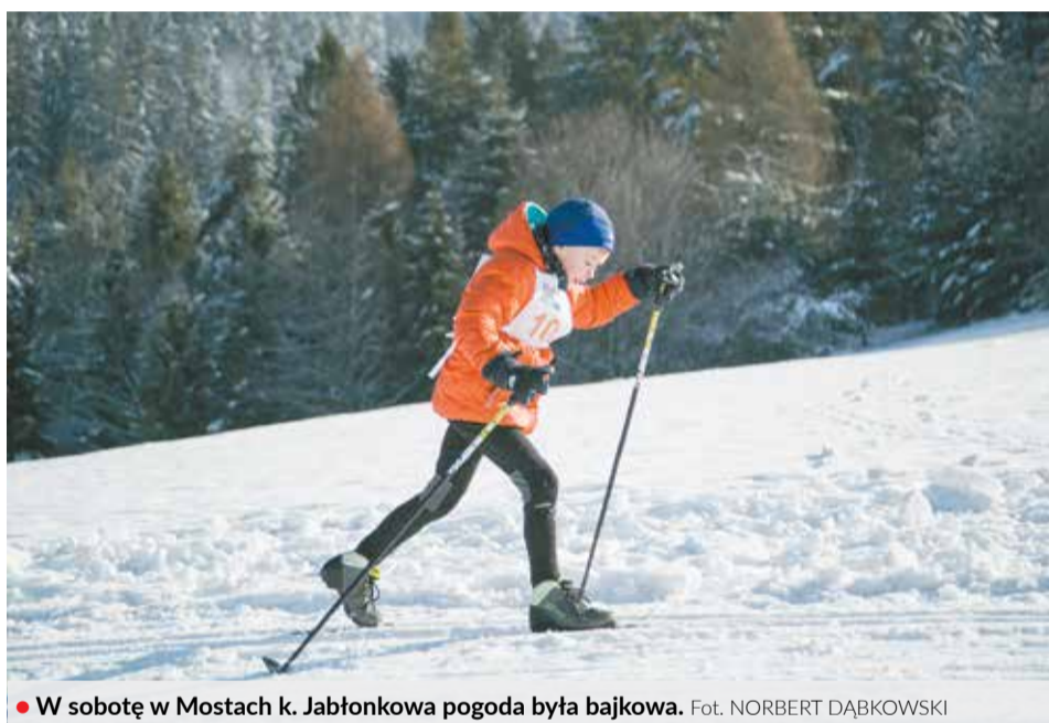
• W sobotę w Mostach k. Jabłonkowa pogoda była bajkowa.

Po raz pierwszy w historii imprezy słowa uznania i wdzięczności do organizatorów, uczestników i ich rodzin skierowała minister sportu RP, Danuta Dmowska-Andrzejuk. „Liczę na to, że dzisiejsze zawo-