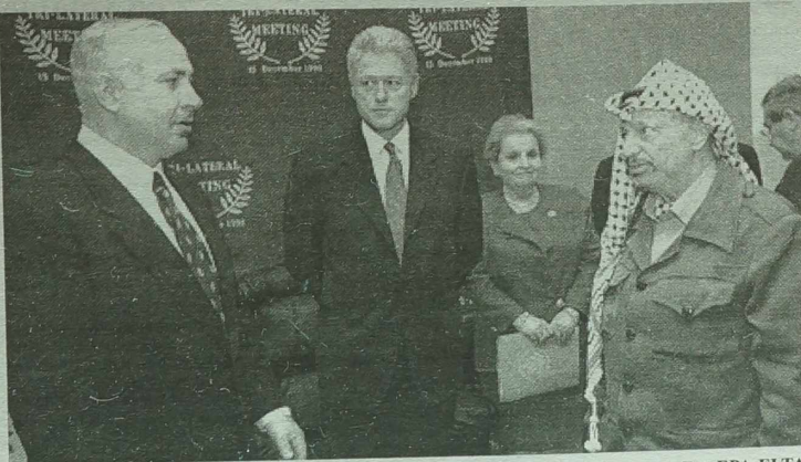
Uczestnicy trójstronnego szczytu.