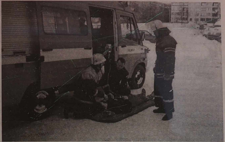
Pierwszą pomoc medyczną poszkodowani mogą otrzymać już od strażaków