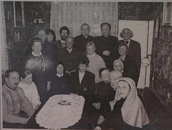
Pamiętkowe zdjęcie z Jego Ekscelencją

Rycerstwa Niepokalanego przy parafii