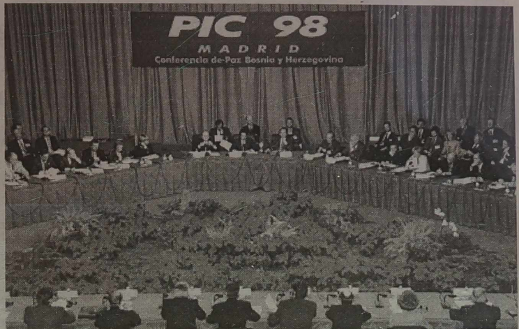
Moment inauguracji konferencji

Podczas otwarcia madryckich obrad sekretarz generalny NATO Javier Solana potępił nową falę przemocy w Kosowie i wezwał obie strony konfliktu do powstrzymania się od aktów terroru.