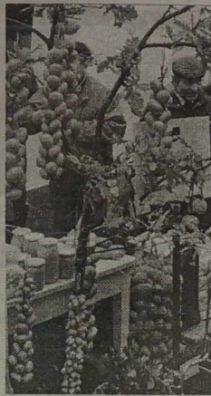
Tegoroczne lato było szczerze na cebule i inne uprawy cebulkowate. Nie braknie ich zatem ani w spiżarniach ogrodników, ani też na targowiskach.

Chce się wierzyć, że wyżej wyszczególnione zalety majeranku przekonają działkowców, którzy go dotychczas nie uprawiali, do poważnego potraktowania tego ziele. A zatem, dłużej nie zwlekając, należy zastosować się o jego nasiona, by z nadejściem nowego sezonu - przeznaczyć pod nie male poletko.