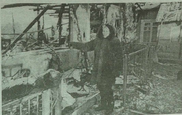
Tu mieszkało osiem rodzin.