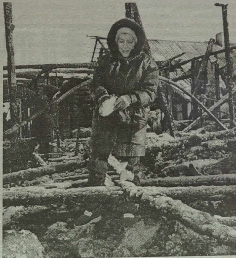
Resztki sukni ślubnej.