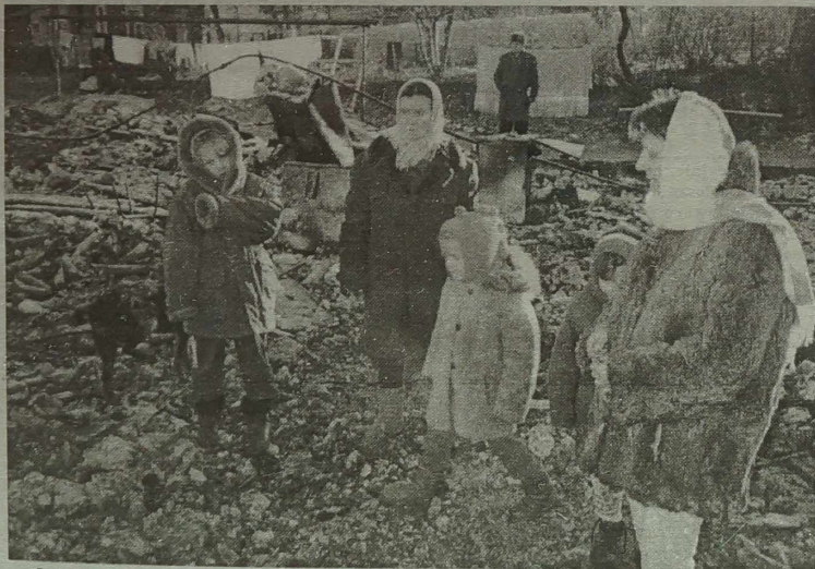
Ogień zniszczył wszystko.

AB Lietuvos Žemės Ūkio Bankas, Trakų skyrius Vytauto 55 Trakai kodas 260101427 atskaitomotoji sąskaita tel. 51754