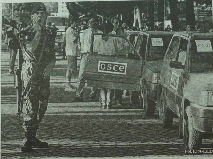
Miloszewi? zgodził się, by weryfikacją wprowadzania w życie swoich zobowiązań zajęło się dwa tysiące obserwatorów OBWE.

Pod groźbą nalotów NATO Miloszewi? zgodził się w ostatniej chwili na wypełnienie żądań ONZ, która domaga się wycofania sił serbskich z Kosowa, umożliwienia powrotu uchodźców i nawiazania poważnych rozmów z separatystami albańskimi w prowincji.