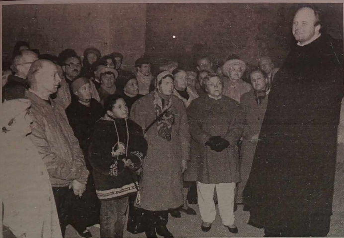
Inauguracja kolejnego cyklu tradycyjnych wycieczek Grona Miłośników Wilna przy "KW"