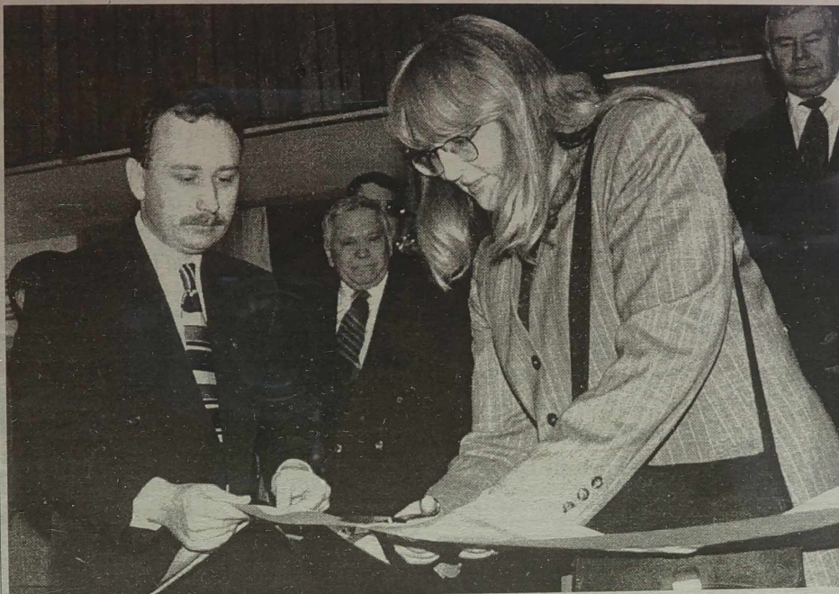
NA ZDJĘCIU: wiceminister rolnictwa RL Natalia Kazlauskienė i prezydent Polsko-Litewskiej Izby Gospodarczej Mariusz Salamon dokonują oficjalnego otwarcia Targów.

(Szerzej o Targach Kowińskich na str. 8)