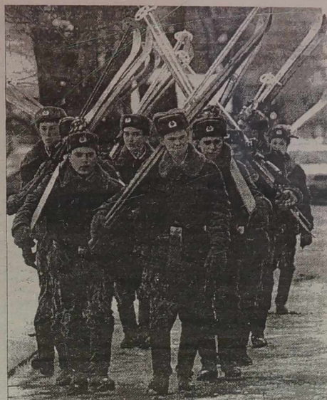
W Królewiec pozostało 100 tys. rosyjskich żołnierzy.

Zdaniem zachodnich analityków, militarno-strategiczne znaczenie tego obwodu dla Rosji jest o wiele bardziej istotne od gospodarczego, gdyż umożliwia Mo-