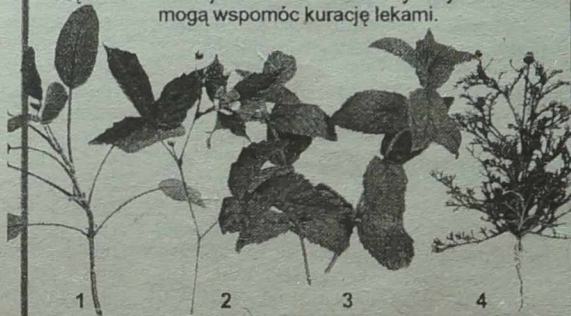
1. Szalwia purpurowa (zalecana przy bólu gardła). 2. Malina właściwa (działa przeciwgorączkowo i napotnie). 3. Mięta długolistna (ma działanie bakteriobójcze). 4. Rumianek bezpromieniotwórczy (łagodzi stany zapalne).

Angina to zapalenie migdałków spowodowane zakażeniem paciorkowcami. Charakteryzuje się wysoką gorączką i silnym bólem gardła. Wymaga porady lekarskiej, ponieważ często konieczne jest zastosowanie antybiotyków. Zioła mogą wspomóc kurację lekami.