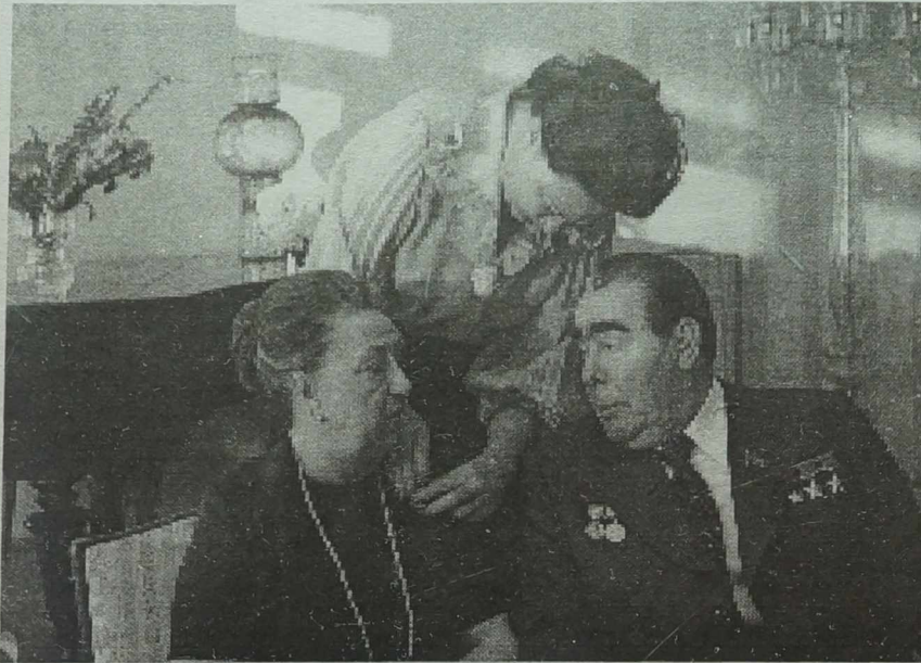
Breżniew z rodziną w latach siedemdziesiątych. W środku córka Galina

Galina Breżniewa, córka długoletniego przywódcy ZSRR, Leonida Breżniewa, zmarła w wieku 69 lat - poinformowała agencja ITAR-TASS.