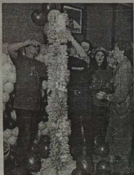
łych na premierze tego filmu w kinie „Lietuva”.