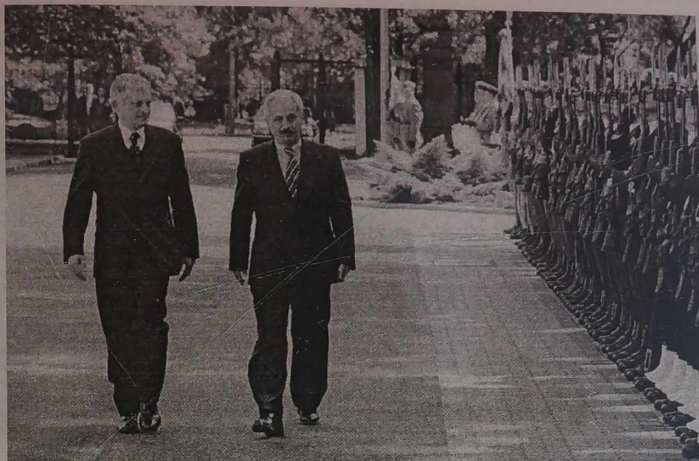
NA ZDJĘCIU: premierzy Rumunii Radu Vasile i Polski Jerzy Buzek podczas ceremonii powitania.

Ustalono tematy przyszłych rozmów dwustronnych. Jeszcze w czasie wizyty Vasile może zostać podpisane porozumienie o współpracy między Polską a Rumunią, dotyczące reformowania ochrony zdrowia.