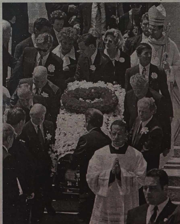
NA ZDJĘCIU: pogrzeb Franka Sinatra.

Decyzja Clintona jest ostatnią z serii posunięć jego administracji, mających zapewnić większą ochronę na wypadek tego rodzaju ataków.