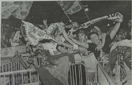
Szał radości na trybunach.