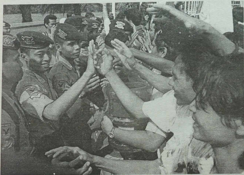
NA ZDJĘCIU: radość studentów i policjantów z dymisji Suharto.