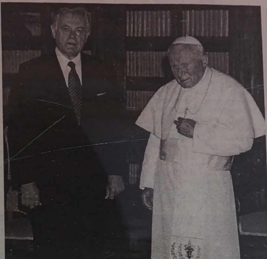
NA ZDJĘCIU: Prezydent Litwy V. Adamkus podczas niedawnej audiencji u papieża Jana Pawła II.

Wskazują również na główną, zdaniem wielu, cechę pontyfikatu Jana Pawła II: ciągle zwrócenie ku przyszłości, ku której papież-pielgrzym nie strudzenie podąża, bez obaw i pełen ufności, która przekazuje innym.