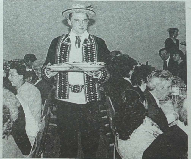
Członkowie zespołu „Wilia” pomagają w podawaniu gościom dania gorącego.