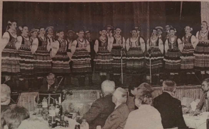
Na scenie - „Wilia” podczas występu dobroczynnego.

(Dokończenie ze str. 6) w naszym środowisku piosenki o kochaniu i innych całkiem ziemskich sprawach.