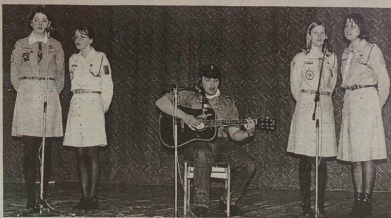
Harczerze - dla swoich rodziców i dziadków.