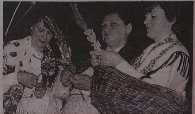
Fragment wystąpienia „Cichej nowinki” z Ciechanowiszek.