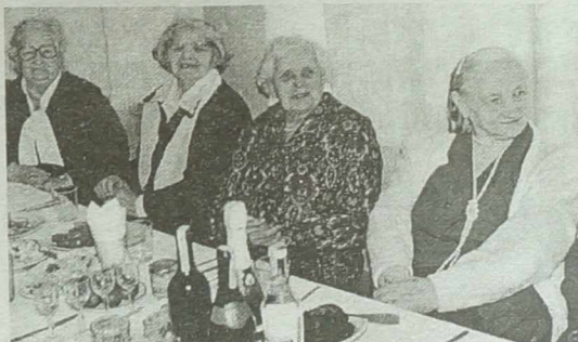
Dawnych wspomnień czar.