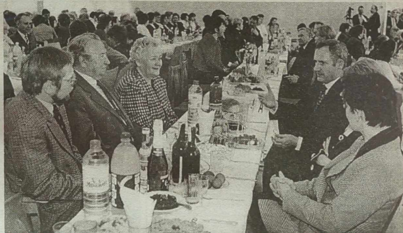
Przy wspólnym stole wielkanocnym.