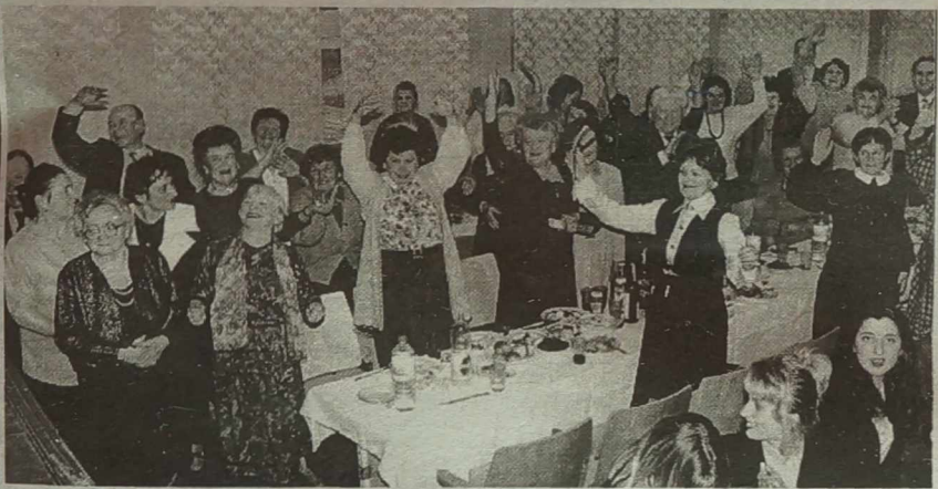
Wspólna radość i wspólne śpiewanie.