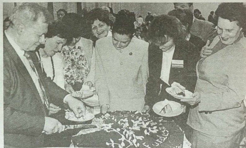
Wielki tort od restauracji „Alina”.