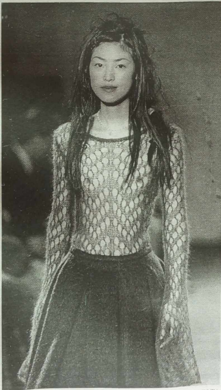
NA ZDJĘCIU: wczorajszy pokaz mody w Tokio z kolekcji „Wiosna 1998”.