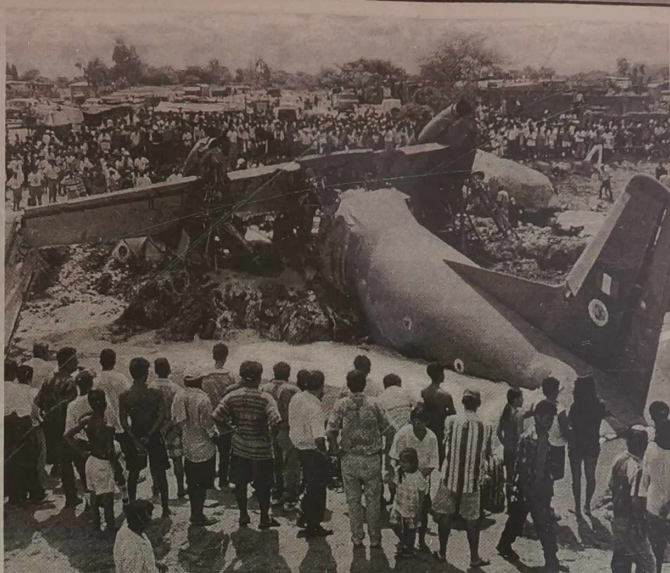
NA ZDJĘCIU: katastrofa peruwiańskiego samolotu. Zginęło 28 osób, zaś 15 zostało żywych dzięki akcji ratowniczej. Katastrofa lotnicza, która miała miejsce 28 marca została spowodowana działaniem atmosferycznym „El Nino”.