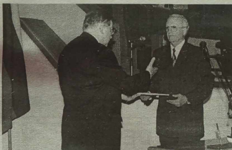
Marszałek Sejmu Vytautas Landsbergis składa gratulacje nowo mianowanemu ministrowi zdrowia Mindaugasowi Stankevičiusowi.

Jednocześnie na zapytanie agencji ELTA około godz. 16 kierownicy Prokuratora Generalnej oraz pracownicy pokoju przyjąć nie mogli jeszcze potwierdzenia otrzymania podania L. Andrikiene.