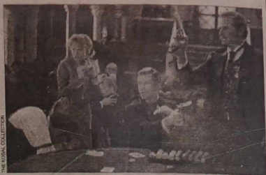
Fabula filmu „Maverick” była osnuta wokół pokera. Prawdziwi gracze podporządkowali wszystko wielkiemu turniejowi - za główną stawkę gotowi byli poświęcić życie.

W kasynie gry obsługuje krupier - tasuje karty, rozdaje je, anonsuje wysokość zakładów itp. Nad prawidłowością przebiegu gry czuwa inspektor - kierownik stołu.