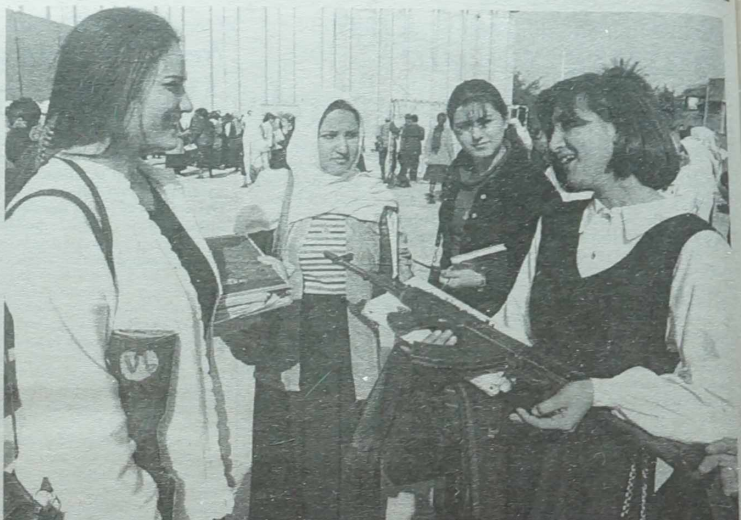
NA ZDJĘCIU: mimo zawarcia porozumienia Annan-Aziz na uniwersytecie w Bagdadzie studentki ćwiczą z automatem AK-47.

Rząd izraelski - najwyraźniej, by uspokoić opinię publiczną - zapewnił, że dzięki satelitom państwo żydowskie jest w stanie ustalić „w ciągu 5-7 minut”, czy Irak wystrzelił pocisk raketowy. Satelity te pozwalają „bezbłędnie” określić miejsce, gdzie spadnie pocisk i zneutralizować go jeszcze w czasie lotu. Tego rodzaju deklaracje mają uspokoić opinię publiczną, że „wszystko jest w porządku”. Rzecz w tym jednak, że większość izraelskich polityków nie wie-