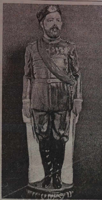
Jest i miejsce dla butelkowego Mikołaja II...

Niezwykle bogaty świat form szklanych stworzyły stare wina. Francuzi, Włosi i Węgrzy ustalają gatunki