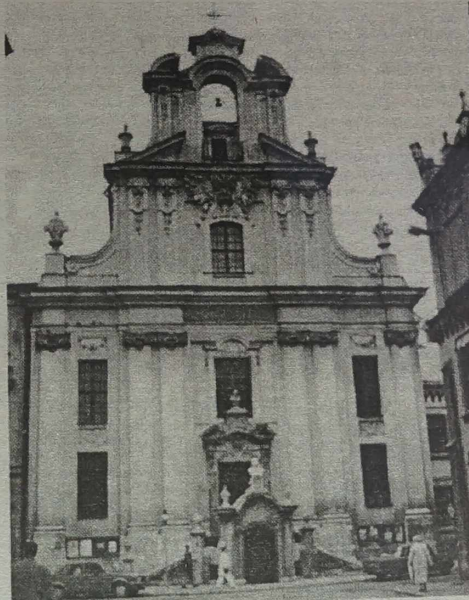
Kościół Św. Jana w Krakowie.