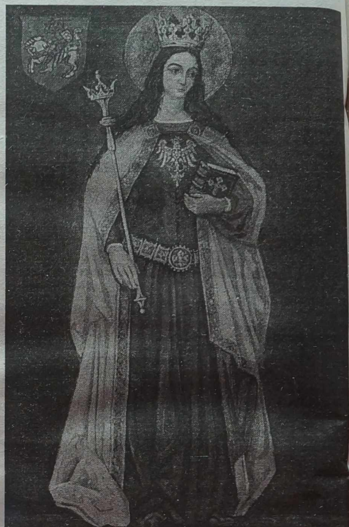
A. Żurawski „Błogosławiona Królowa Jadwiga”, 1981 r.

Znak krzyża! Klęcząc na tych kamieniach, przy Krzyżu