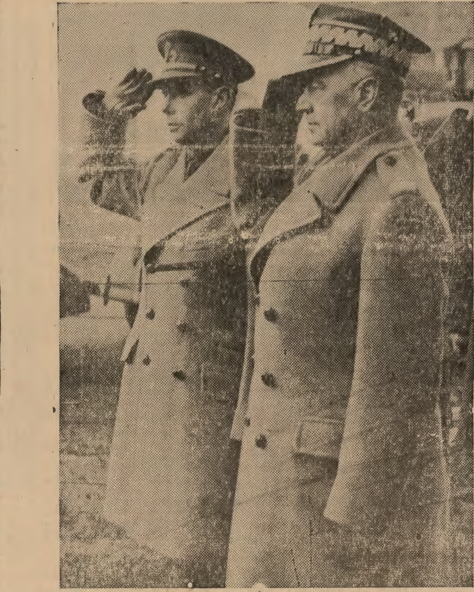
Gal. Sikorski e Rei George VI recebem o desfile das tropas polonesas encarregadas da defesa da Escocia

LONDRES, (A. P.) — Uma fonte autorizada britânica declarou que os russos já estão discutindo a eventualidade de campanhas de grande envergadura "na próxima primavera e em Agosto de 1942". A referida fonte manifestou a esperança — cada vez mais accentuada nos círculos britânicos — de que a União Soviética possa resistir por todo o inverno, acrescentando que a luta na frente oriental já se tem tornado a mais sangrenta de