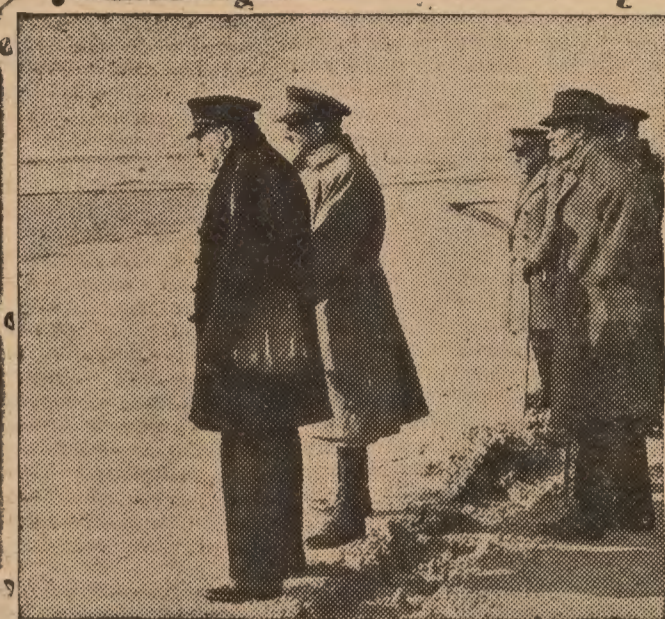
Churchill acompanhado por Sir Alan Brooke — Comandante em Chefe das Forças de Defesa Nacional — Cap. Margesson, Secretário do Estado da Guerra e maiores do Exército e da Marinha assiste a uma demonstração de medidas de defesa das costas inglesas.

lho paciente e vitorioso pela conservação. Não pode cultivar o espírito livremente: cultivava na surdina, no recesso dos lares, às ocultas da vigilância dos ocupantes, não perdendo uma hora vaga. Cada adulto é mestre de um ou mais dos seus compatriotas, e quando a vigilância acesa do inimigo se extrema, o mestre desaparece e o estudante sempre recebe um exemplar dos livros já feitos aos milhões, para a formação de autodidatas. O exército de policiais que se esforça por impedir essa obra é grande; mas é maior, mais cheio de vida, mais colante o outro que reage e vai vencendo o esforço de quantos querem levar um povo inteligente ao obscurantismo.