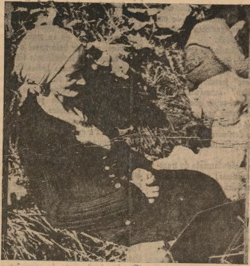
Um quadro característico da "nova ordem" preconizada por Hitler. Uma família de camponeses arrancada do seu lar, dorme ao relento.