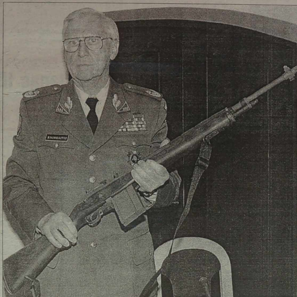
Wg ekspertów amerykańskich M14 szczególnie obawia się wrogoci

Spójrzmy spokojnie, co to za cudo. Karabin M14 jest rozwinięciem karabinu M1, który stanowił uzbrojenie armii amerykańskiej w czasie II wojny światowej.