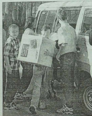
Niniejsza akcja nie jest pierwsza. Przed świętami wielkanocnymi przekazaliśmy wychowankom internatu dary przyniesione do redakcji przez naszych czytelników. Wtedy do akcji dołączyli też uczniowie szkoły średniej im. J. I. Kraszewskiego oraz UAB „Tužiła”

Czwartkowej nocy na białorusko-litewskiej granicy znaleziono wóz ze szmuglowanym alkoholem. Funkcjonariusze strażynicy w Tribonai zauważyli „pojazd” w nie ogrodzonym sadzie, w zagrodzie, należącej do mieszkańca wsi Purwėnai, mniej więcej w odległości kilometra od granicy państwowej.