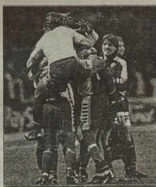
Tak cieszyli się piłkarze Fiorentiny po strzeleniu gola na Wembley.

występowali: bramkarz Jerzy Dudek i Tomasz Rząsa. Na 8 stadionach w środę padły 23 bramki; w meczach wtorkowych odnotowano 22 gole.