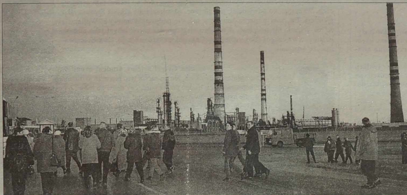
Nowy Związek (socjalliberałowie) zorganizowali wczoraj przy rafinerii w Możejkach akcję - „Karawana Nadziei” - „Williamsowi” - „Nie”.

W przeddzień planowanego podpisania umowy rządu litewskiego z amerykańską spółką „Williams International” Nowy Związek (socjalliberałowie) przeprowadził akcję protestacyjną „Karawana Nadziei” - „Williamsowi - Nie”.