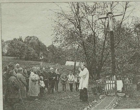
Oby ten krzyż był światłym drogowskazem każdego przechodnia

niszczył i wysadzał w powietrze wszystkie przydrożne symbole kultu religijnego. Jednak im bardziej je niszczone przy drogach, tym głębiej te krzyże zapadały do