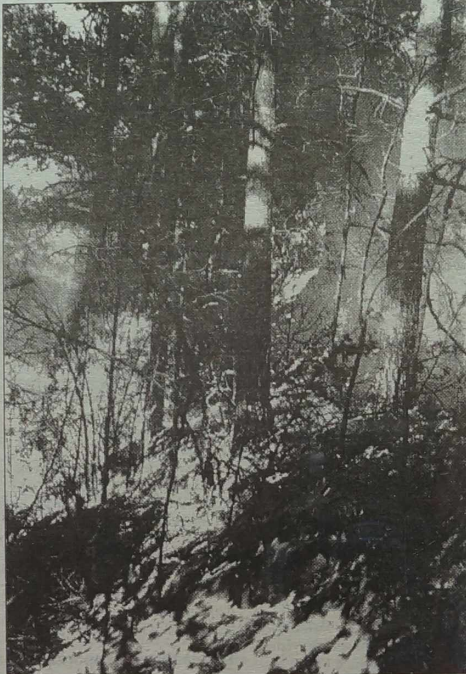
Skomplikowana sytuacja pożarowa jest w całej republice. Jedynie w rejonie trockim wybuchło na torfowiskach 5 dużych pożarów.

Na posiedzeniu zapadła decyzja zwrócenia się do służby okre-