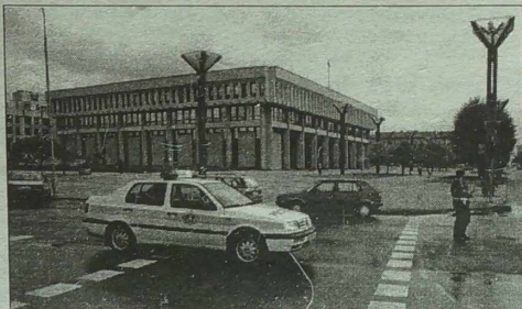
Na informację o tym, że w Sejmie znajduje się ładunek wybuchowy bardzo operatywnie zareagowała policja

Wczoraj funkcjonariusze służb specjalnych nie wykryli przy gmachu Sejmu ładunku wybuchowego, o którym rano tego dnia powiadomili telefonicznie anonim służb dyżurnych Głównego Komisariatu Policji m. Wilna.