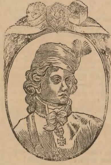
Tadeusz Kościuszko, bohater Polski i Ameryki, który na polach bitew przypieczętował zasady Konstytucji 3-go Maja. Tadeusz Kościuszko, heroi da Polónia e da America que nos campos de batalha selou os principios da Constituição de 3 de Maio.

Uplywa 150 lat jak w 1781 r. została ogłoszona w Warszawie Konstytucja Majowa Rzeczypospolitej Polskiej. Był to jeden z fundamentów nowoczesnego porządku świata. Jest to polska Deklaracja Wolności, siostrzyca francuskiej Deklaracji Praw Człowieka i amerykańskiej Deklaracji Niepodległości. Duch majowy powiódł Kościuszkę pod Racławicami, a później, w latach 1831, 1863 i 1914 prowadził zbrojne zastępy Polaków w bój o niepodległość. Tak w chwilach niepowodzeń jak w chwilach zwycięstw, tak w godzinach cierpienia jak w godzinach radości, Naród Polski krzepi się stale u wiecznie żywych wód Konstytucji 3-go Maja. W 150 lat po ogłoszeniu Praw Wolnego Narodu, ziemie polskie leżą znów pod chwilowym