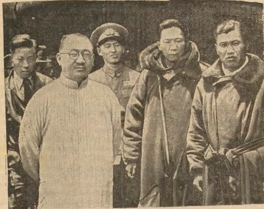
LOTNICY CHIŃSCY Lotnicy chińscy odbyli niedawno nalot na Japonię, lecz zrzucili tam nie bomby, a rozrzutki. Po powrocie powitał ich pierwszy minister chiński dr. Kung (w białym płaszczu).