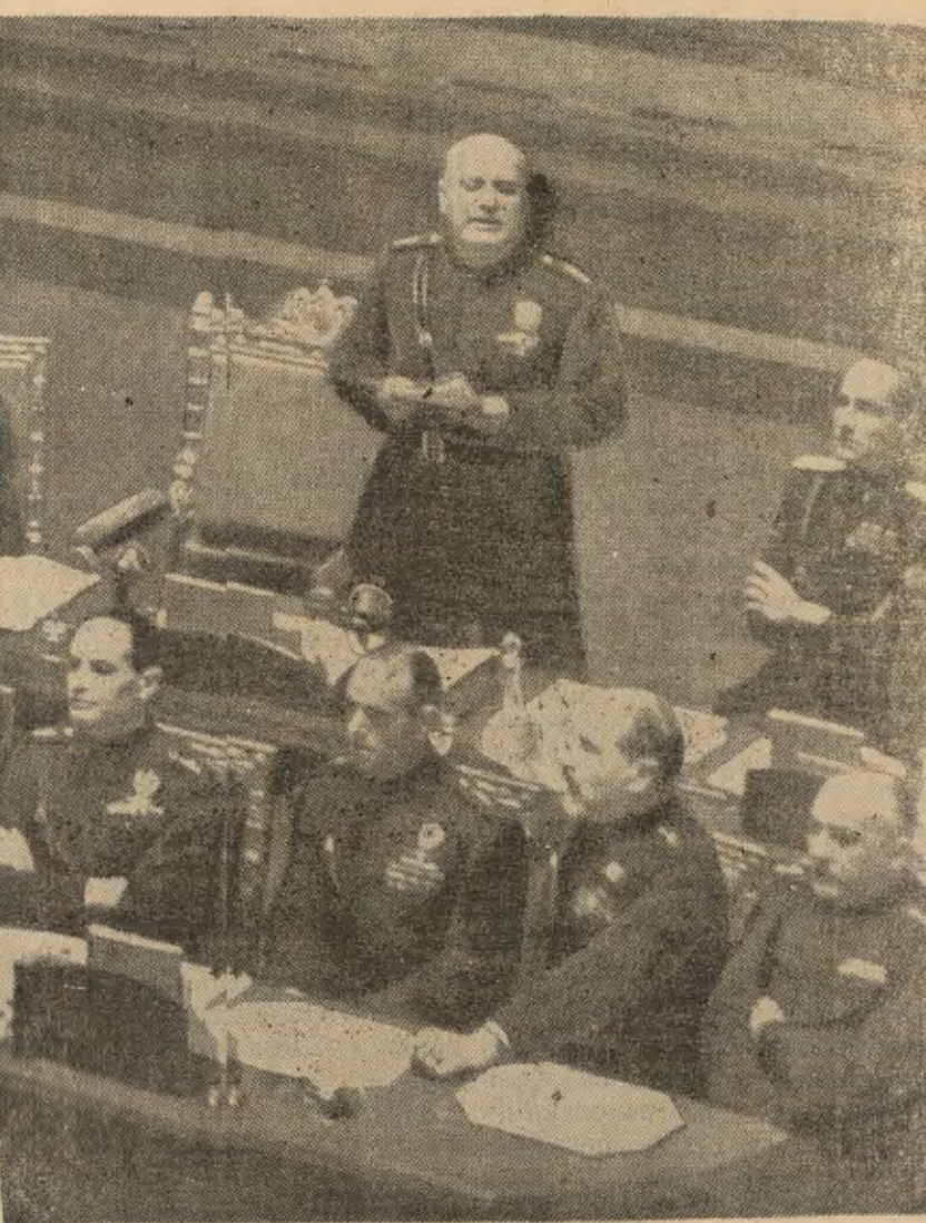
Czy podejmiemy na nowo „ofensywę pokojową”? Dyktator włoski i Mussolini, przemawiający na radzie „czarnych ko- szul” czyli partii faszystowskiej. Jak wspominaliśmy, Hitlerowi za- leżało bardzo na spokojnym trawieniu zdobyci polskiej i przy- gotowaniu się do dalszych podbojów, skutkiem czego umizga się do Mussoliniego o wystąpienie z nową „ofensywą pokojową”.

dbują w Dakarze, poczem wy- syłani są do Francji.