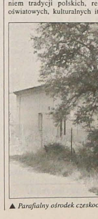
Parafialny ośrodek czechokreszowskiego zbora na Niwach.