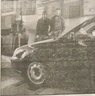
W estetycznej i higienicznie wyposażonej kuchni Zintegrowanej Szkoły Średniej w Jabłonkowie przygotowywane są dla młodzieży kucharze... Proba hamulców na urzędzie MAHA...