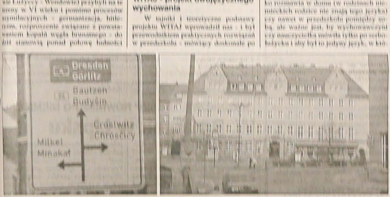
Dwujęzyczne drogowiczki • Dom Serbki w Budżiszynie.

Właściwość drogą do sukcesu... tak można scharakteryzować przynaj-