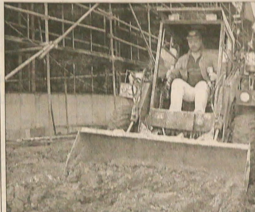
ciąg dalszy na str. 2

Tym razem plakietkami uhonorowano 101 osób. Jedyną motywacją tych ludzi do regularnego oddawania krwi, a także plazmy i płytek krwi na potrzeby służby zdrowia, jest pragnienie spełnienia swego humanitarnego obowiązku wobec bliźnich, których życie niejednokrotnie uzależnione jest wyłącznie od natchemistowej transfuzji. Taka postawa honorowych krwiodawców godna jest najwyższego uznania i szacunku całego społeczeństwa. Dodatkową nagrodą dla obdarowanych plakietkami krwiodawców był ufundowany przez ostrawski magistrat roczny darmowy bilet na środki komunikacji miejskiej. Godzi się dodać, że wśród uhonorowanych krwiodawców tym razem znalazło się 29 pracowników kopalni.