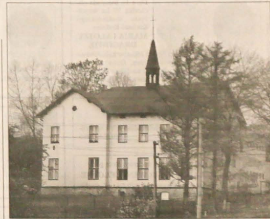
Gmach milikowskiej „szkoły z wieżyczką” służy szerzeniu oświaty już od 1904 roku. Dziś lokum znalazły tu szkoły i przedszkola zarówno polskie, jak i czeskie.

Milików jest rozległą wioską i dziecią szkół przychodzi do przedszkola z różnych odległości. Pokonują je często autobusem, jeżdżąc z jednego kierunku od „Warcopa”, a z drugiego kierunku