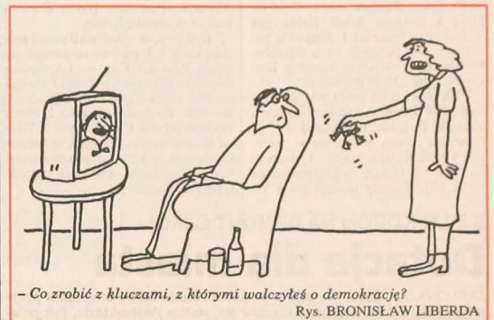
- Co zrobić z kluczami, z którymi walczyłeś o demokrację?

Kiermaszowi towarzyszyć będzie mini-wystawa prac Bohdana Butenki; jego wieczór autorski rozpocznie się o godz. 17.00.