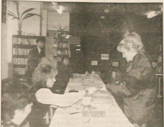
▲ Nie było minionej niedzieli tloku w lokalach wyborczych - do urn zdecydowało się pójść zaledwie okolo 30 proc. uprawnionych do głosowania. Na zdjeciu: W lokalu wyborczym w bibliotece Domu Kultury w Rychwaldzie.

ŚRODA - Zachmurzenie bez większych zmian. Temperatura w dzień 9 - 13 st., w nocy 8 - 4 st. C.