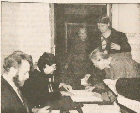
▲ Również obywatelki polscy zamieszkali w RC wzięli w niedzielę udział w powszechnych wyborach prezydenta Rzeczypospolitej Polskiej. Głosy oddawano w lokalach wyborczych w Klubie PZKO przy ul. Bożka w Cz. Cieszyń (zdjęcie z lewej) oraz w siedzibie Konsulatu Generalnego RP w Ostrawie.