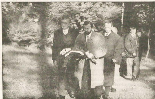
▲ Goszczący na Zaolziu posłowie na Sejm RP złożyli w niedzielę wieniec pod pomnikiem Zwirki i Wigury w Cierlicku-Kościele.

W związku z tym, że w czwartek 28 września przypada święto państwowe, kolejny numer „Głosu Ludu” ukazuje się dopiero w sobotę 30 bm. (P)